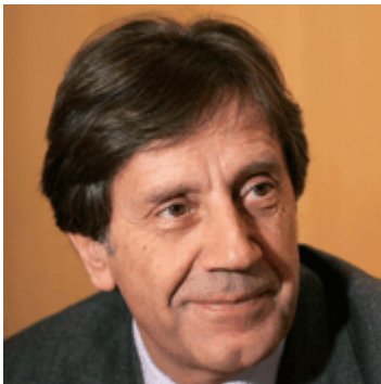
Penosa actuación del líder socialista