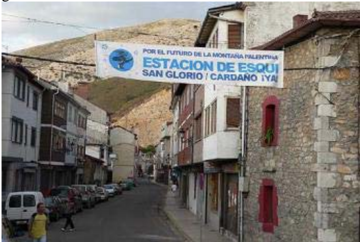
Cartel en velilla del Río Carrión

El interés de un grupo de empresarios en construir una estación de esquí en esta zona de la cordillera cantábrica tan castigada por la despoblación, el cierre de empresas, la huida de la juventud a las grandes ciudades y la situación de abandono que padecemos, ha provocado la constitución de manera independiente de tres asociaciones en la montaña leonesa, cantabra y palentina, contando con el apoyo de la mayoría de sus habitantes ,sus ayuntamientos así como por toda la hostelería, el comercio, las empresas y asociaciones en general.