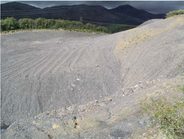
Explotación a cielo abierto en Muñeca