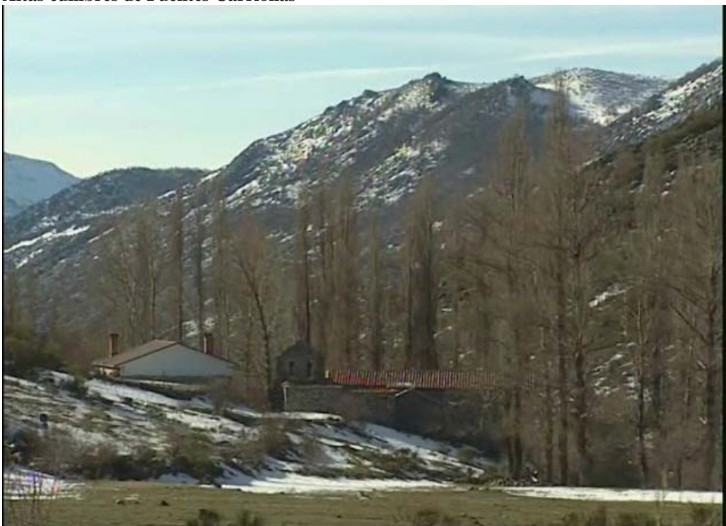
Cardaño de Arriba