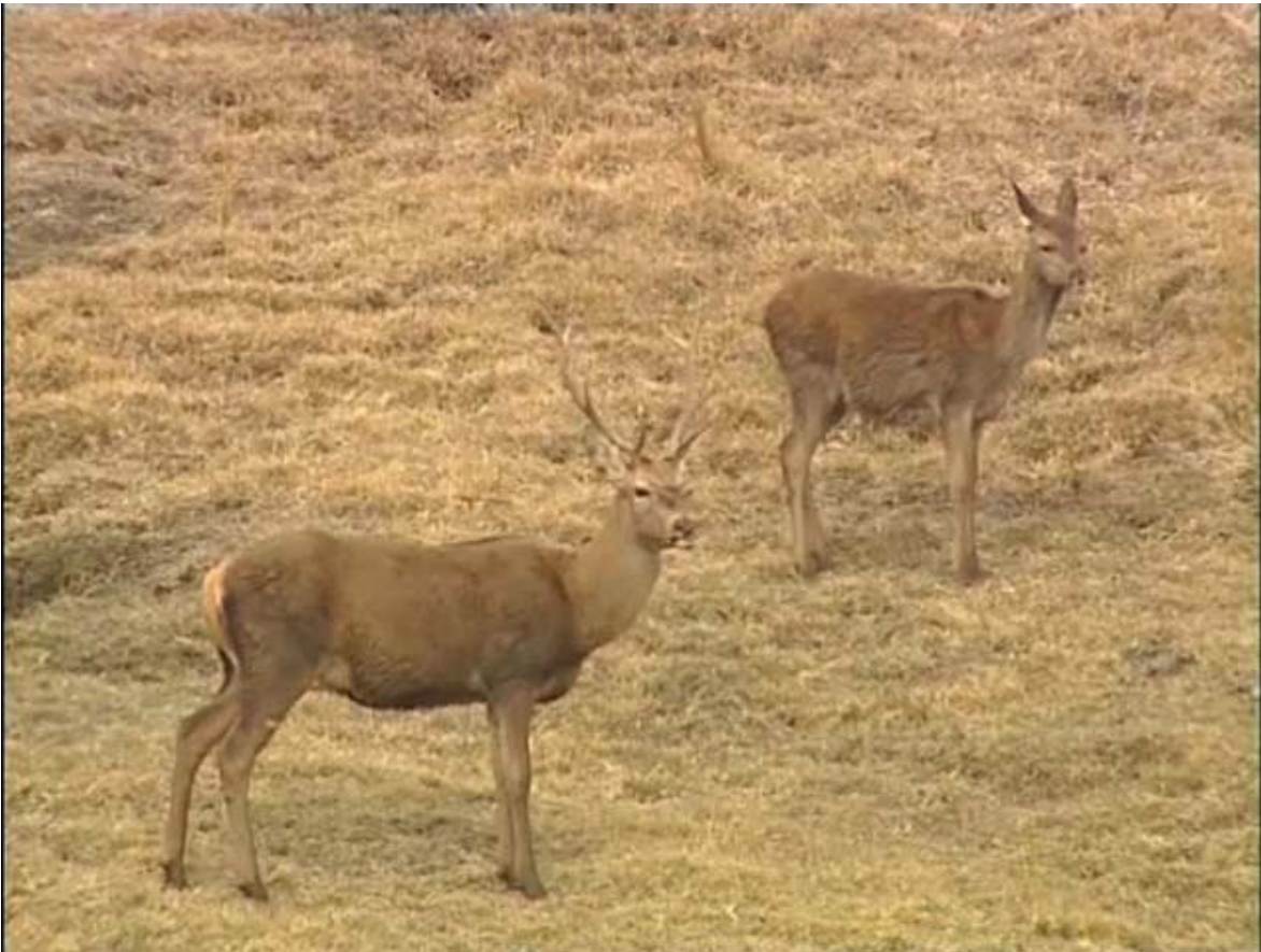
Cérvidos en las altas zonas de pasto del Parque

A continuación, para abrir apetito, unas capturas del vídeo