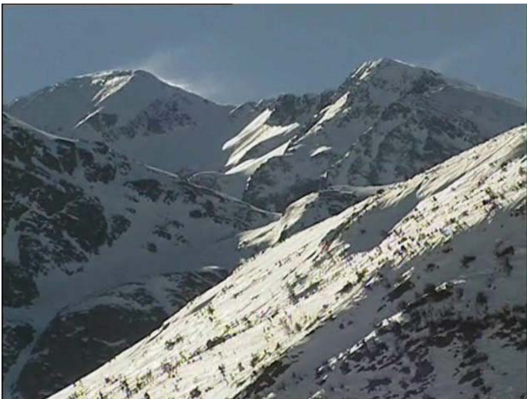
Altas cumbres de Fuentes Carrionas