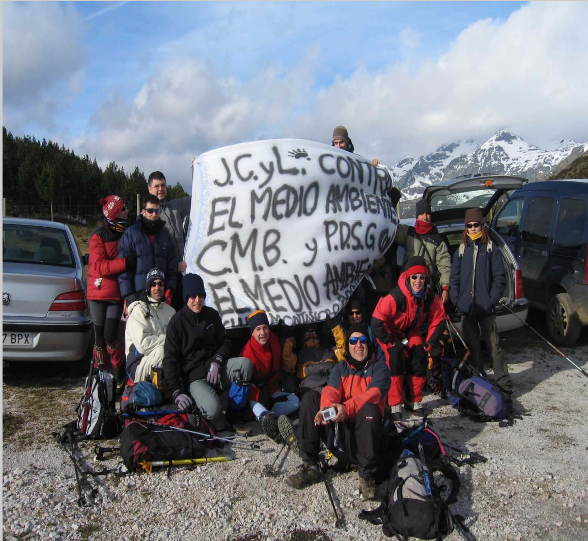
Compañeros del Club Benaventano de montaña apoyando el evento