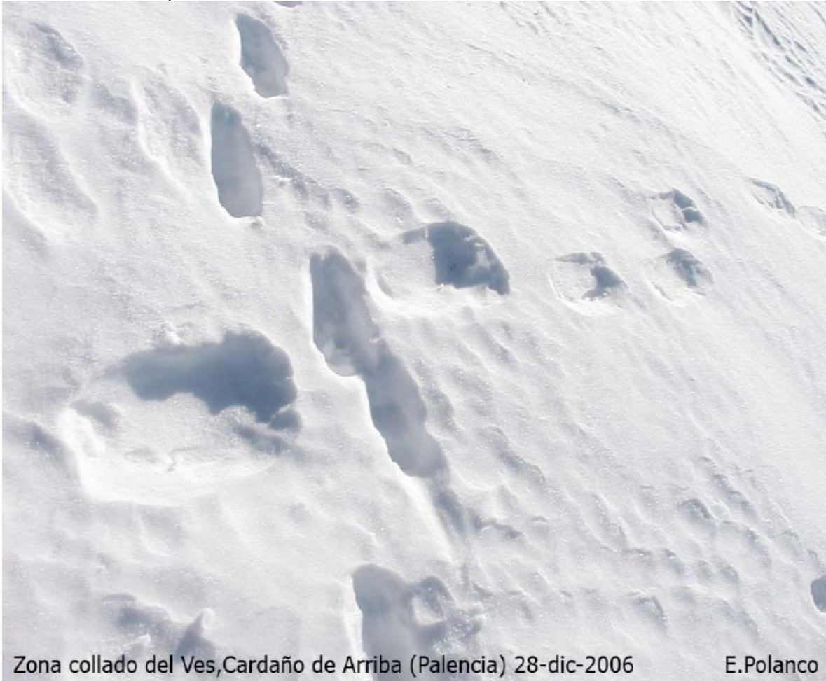
Zona collado del Ves, Cardaño de Arriba (Palencia) 28-dic-2006

infraestructuras se refiera, al puerto de San Glorio, Collado de Robadorio, Cabecera del valle de lechada y cabecera de Valponguero, El acceso por carretera a través de Cardaño con la presión demográfica que esto traería, dificultaría en extremo el posible tránsito a través de este valle, de manera que se producirán interacciones críticas y totalmente incompatibles con el hábitat oso.