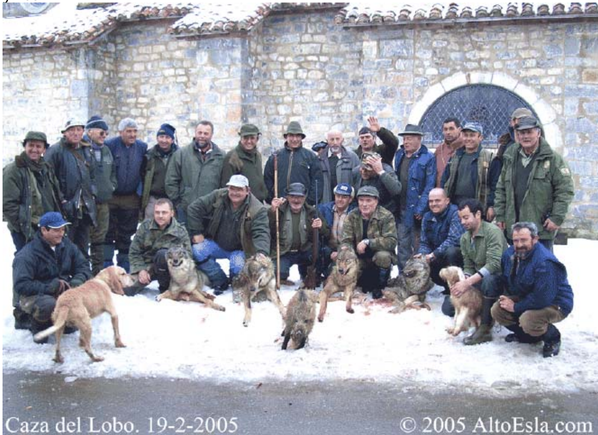
Ilustración 1: Fotos 1 y 2. El fomento de la caza en Castilla y León como herramienta prioritaria de gestión para depredadores como el lobo resulta retrógrado y difícilmente justificable desde la ética y la conservación. En estas fotos, los resultados de una batida con nieve (prohibida por la ley de Caza 8/1991 de Castilla y León) y con la presencia de celadores y guardas de la RR.CC. de Riaño (León).

La gestión de las poblaciones de lobo ibérico ( Canis lupus signatus ) en los Espacios Naturales Protegidos de la Cordillera Cantábrica es un ejemplo más de una política en la cual la única herramienta de gestión es la caza, especialmente en Castilla y León.