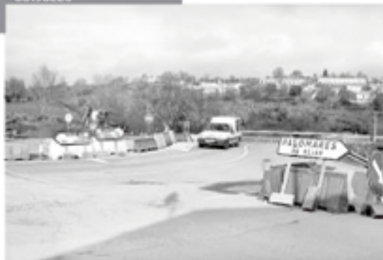
Corte de la carretera por las obras de Palomares. Las obras de la rotonda de Palomares han obligado a cortar desde el pasado jueves un pequeño tramo de la carretera de Salamanca de modo que los vehículos han de dar un nuevo rodeo para entrar en Béjar./ENE