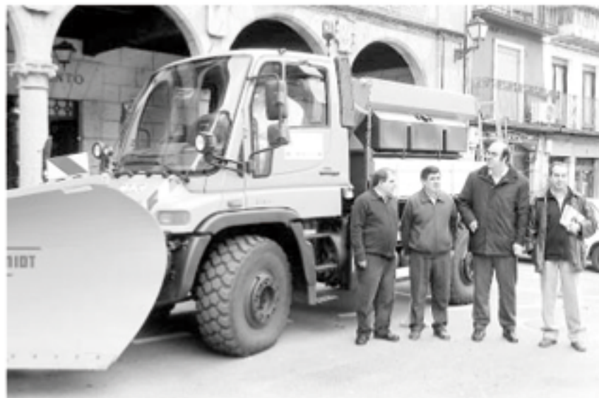
La Diputación presentó ayer la nueva máquina quitanieves, que dará servicio a la comarca y la estación.